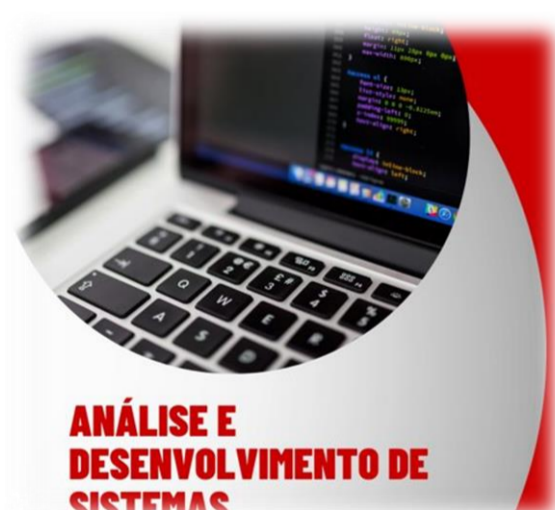
ANÁLISE E DESENVOLVIMENTO DE SISTEMAS