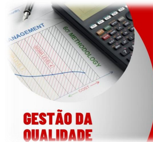
GESTÃO DA QUALIDADE