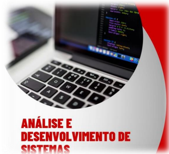
ANÁLISE E DESENVOLVIMENTO DE SISTEMAS