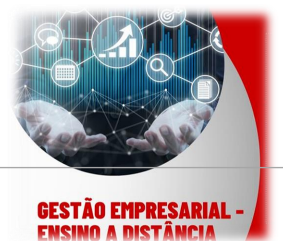
GESTÃO EMPRESARIAL - ENSINO A DISTÂNCIA